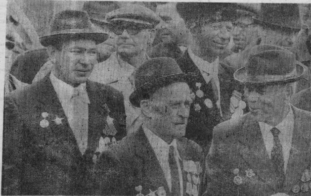
1984 г. с. Кежма. Ветераны второй мировой.