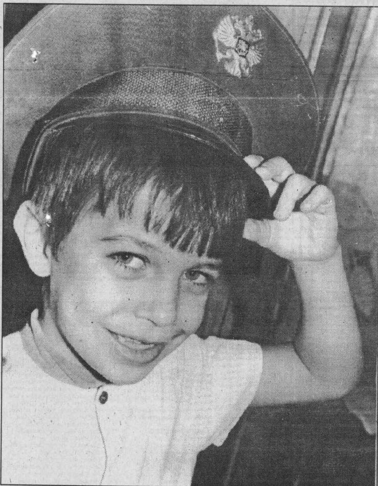
Расти, защитник Отечества!