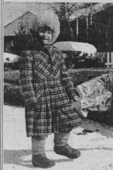
По утрам, как всегда, в магазин иду за хлебом.