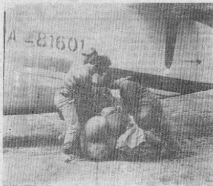
Подготовка снаряжения к загрузке.