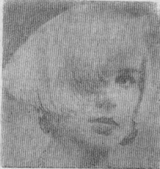
Этой процедуры усиливается приток крови к корням волос и усиливается их питание. ЧЕШКОЛЬСКО РЕЦЕПТОВ ВИТРИАНИЯ

Разделите волосы на ряды втирая от макушки и ватным тампоном или кончиками пальцев витрируйте в проборы лечебную смесь. При этом вы еще и производите легкий массаж головы. В результате