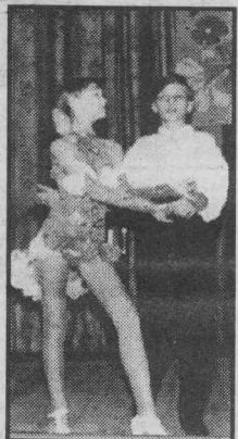
На сцене «Грация» (рук. С. Никифорова).