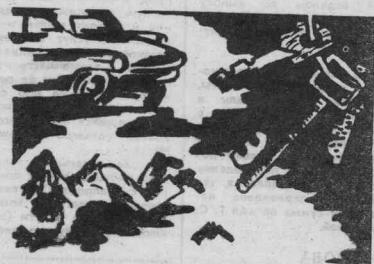
Подготовила Г. БАРАНОВСКАЯ.

ПОДКЛЮЧИЛСЯ к ранее упомянутым вожкам житель Чабоды Р. Вместе с друзьями он выбил дверь квартиры, принадлежащей С., и похитил личное имущество. Он же окорбил односельчанку Г.