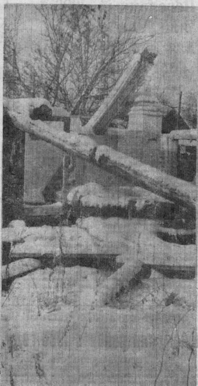
...И снег скрывает все следы.