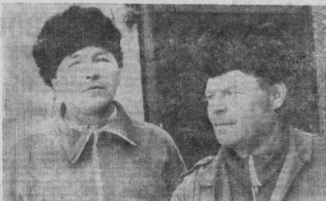
♦ НА БОГУЧАНСКОЙ ГЭС

Информацию подготовили К. ДАНИЛЕНКО и Г. БАРАНОВСКАЯ.