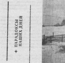
ПАРАЛОКОВЫ НАШИХ ДНЕЙ

новном, специалисты отдела сельского хозяйства и отдела архитектуры районной администрации. В ходе проверки по району из земель сельскохозяйственного назначения были осмотрены площади в объеме 17,7 тысячи гектаров. Из них пашни — 8,3 тысячи га. В частности, обследованы земли шести коллективных хозяйств на площади 8,3 тысячи га, пяти подсобных сельских хозяйств предприятий и учреждений — на площади 1,5 тысячи га сельхозугодий, двадцати трех крестьянских хозяйств на площади 1,8 тысячи га и шести сельских администраций, в чьем владении находятся 5,8 тысячи гектаров.