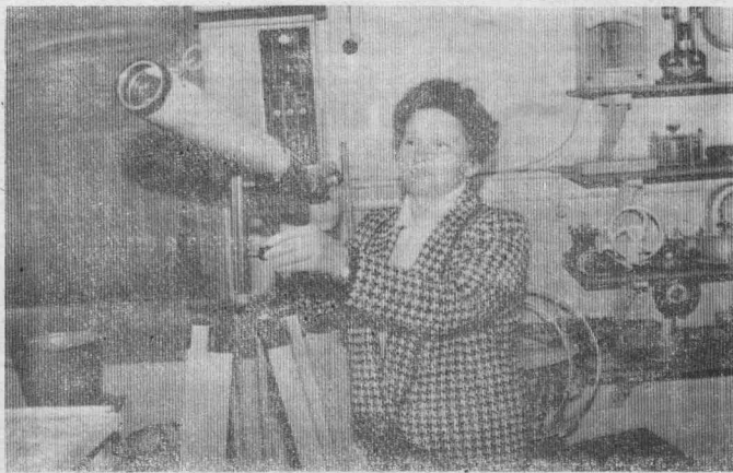
★ ЧЕЛОВЕК И ЕГО ДЕЛО