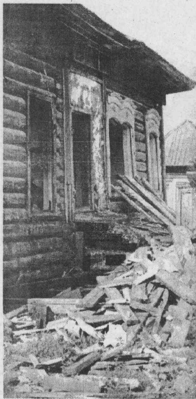
Зона затопления.

Материал, как нам рассказал его автор, подготовлен по просьбе председателя Государственной экологической экспертизы по Богучанской ГЭС Ю. М. МАЛЫШЕВА, возглавлявшего работавшую в начале июля в Кодкинске комиссию. Во в... с ее членами и была выдана и поддержана идея целесообразности создания активного движения жителей зоны затопления, а также всех заинтересованных лиц в быстрейшем завершении строительства Богучанской ГЭС.