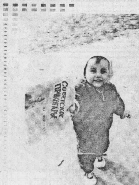
Наше нравственное самочувствие Последний привет