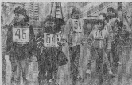
ИХ ПОЗВАЛИ СТАРТЫ.

лей на этот раз была представлена выставка-конкурс «Хозяйство вести — не лапти плести».