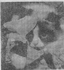
«МИСС-МЯУ» — МАРКИЗА

Порядовала пришедших на кошачий праздник и недавно созданная в ДК детская теат-