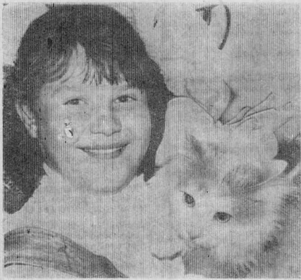
УЧАСТНИКИ ПРЕДСТАВЛЕНИЯ И ИХ ХОЗЯЙКИ