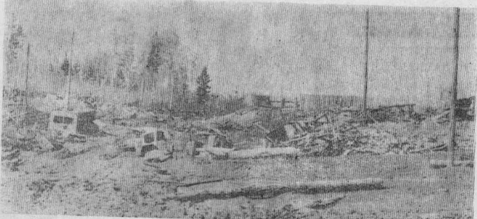
Такая нелицеприятная картина предстает глазам перед въездом в Новую Кузмку, в квартал, где прежде базировалась Пановская ПМК.