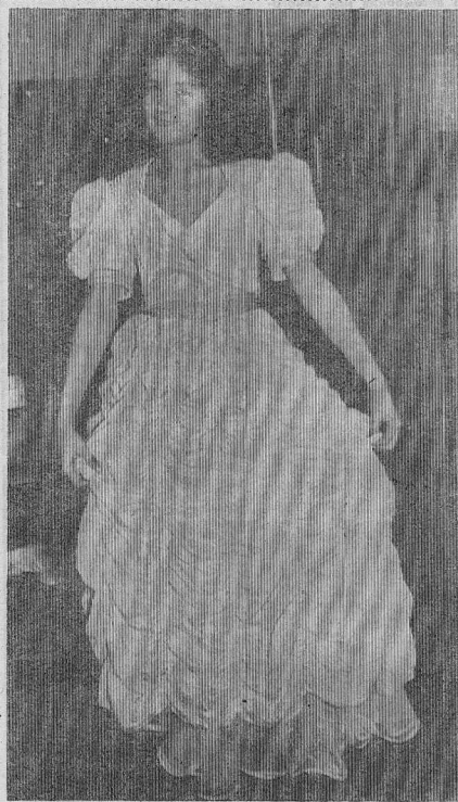
«Идет ли мне это платье?»

КРИТИЧЕСКИЕ ДНИ И ЧАСЫ НА АВГУСТ 1996 Г. 1, четверг [18.00-20.00], 6, вторник [22.00-23.00] 9, пятница [11.00-13.00], 11, воскресенье [18.00-20.00], 22, четверг [20.00-22.00], 24, суббота [17.00-19.00], 27, вторник [18.00-20.00]. По данным д. м. н. В. ХАСАНУЛИНА.