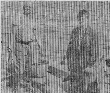
Не перевелась рыба на Дешембинском озере.

На снимке: момент высадки кодичцев из винтокрылой машины в районе озера Дешембинского.