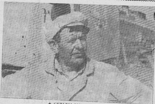
♦ СУДЬБЫ ЛЮДСКИЕ