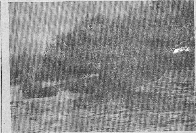
В РАННЕЕ ЛЕТНЕЕ УТРО.

ко Феллини — Джульетта Мазина — 1350 (48%); Джон Леннон — Йоко Оно — 873 (31%); Эдит Пиаф — Мишель Сердан — 607 (21%). ПОЛИТИК ВЕКА — Уинстон Черчилль — 1243 (44%); Михаил Горбачев — 1098 (39%); Де Голль — 489 (17%). ДИССИДЕНТ ВЕКА — Андрей Сахаров — 2279 (81%); Нелсон Мандела — 502 (17%); Вацлав Гавел — 49 (2%). МИРОВОРЕЦ ВЕКА — Мать Тереза — 1764 (62%); Махатма Ганди — 574 (20%); Иоанн Павел II — 492 (18%). УЧЕНЫЙ ВЕКА — Альберт Эйнштейн — 2290 (81%); Сергей Королев — 374 (13%); Зигмунд Фрейд — 166 (6%). Ш П И О Н В Е К А — Рихард Зорге — 1406 (50%); Ким Филби — 895 (31%); Рудольф Абель — 529 (19%). ПРЕСТУПНИК В Е К А — Адольф Гитлер — 1434 (51%); Иосиф Сталин — 1232 (43%); Аль Капоне — 164 (6%). ПИСАТЕЛЬ ВЕКА — Эрнст Хемингуэй — 1260 (45%); Михаил Булгаков — 1193 (42%); Алексей Толстой — 377 (13%). КИНОРЕЖИССЕР ВЕКА — Федерико Феллини — 2055 (73%); Сергей Эйзенштейн — 467 (16%); Андрей Тарковский — 308 (11%). ХУДОЖНИК ВЕКА — Пабло Пикассо — 1686 (60%); Сальвадор Дали — 1019 (36%); Марк Шагал — 125 (4%). МУЛЬТИПЛИКАТОР ВЕКА — Уолт Дисней — 2649 (94%); Вячеслав Котеночкин — 143 (5%); Юрий Норштейн — 38 (1%). СПОРТСМЕН ВЕКА — Пеле — 2363 (83%); Сергей Бубка — 338 (12%); Мохаммед Али — 129 (5%). ПЕВЦЫ, ПЕВИЦА ВЕКА — Федор Шаляпин — 1348