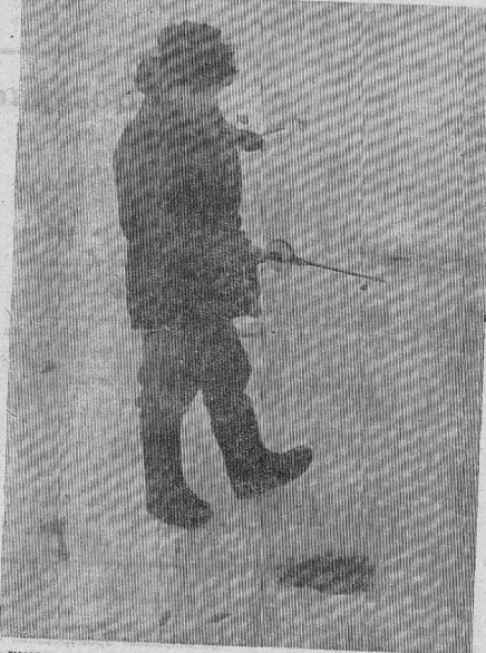
ЕЩЕ ПАРА ОКУНЬКОВ — И ПОЖАЛУЙТЕ НА УХУ!