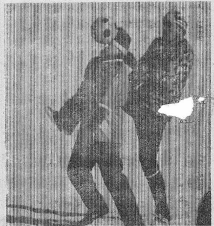
Пять футбольных команд приняли участие в соревновании на заснеженной площадке в Кодишке в прошедшие выходные. Победителем стала команда фирмы «Авангард-электронсистем». На втором месте парни из РОВД, на третьем — СВБса.