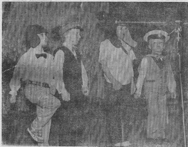
СМЕЛО МЫ В БОИ ПОЙДЕМ...