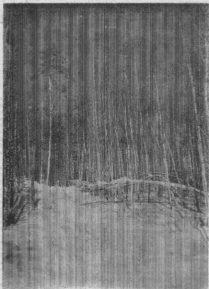
СВЕТ И ТЕНИ.

РАЗМЕНИВАЕТСЯ однокомнатная квартира на двухкомнатную с доплатой. Звонить по тел. 2-22-34. 137