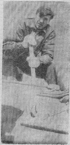
вением мелких недоработок, подготавливая объект к вводу в эксплуатацию. Окончание работ по ссылке введных призм и планировке откосов намечено на октябрь нынешнего года. Именно этот месяц строители моста называют временем завершения строительства.