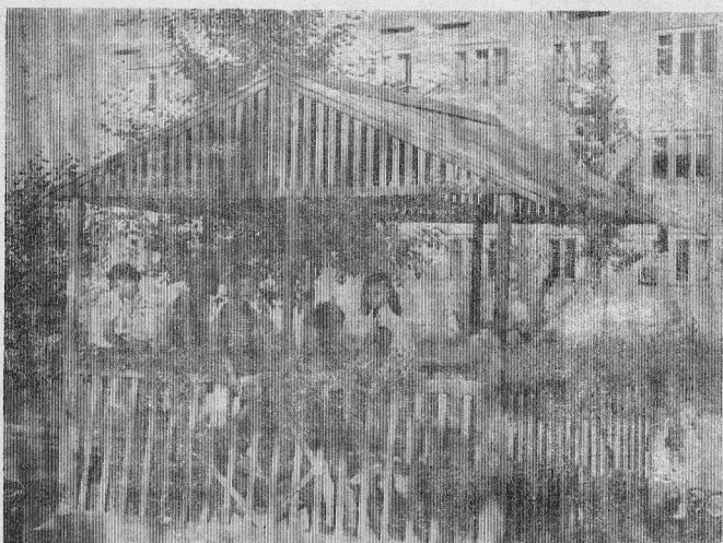
Удобную беседочку построили службы ПЖРЭО перед четвертым общежитием в г. Кюдинске. Есть теперь где детям собраться, да мамам с бабушками удобно из-под крышца за детьми приглядывать. Вот жаль только, что мало подобных строений у нас по городу. По большей части любителям свежего воздуха приходится ютиться у подъездов, вдыхая отнюдь не свежие ароматы находящегося рядом мусоропровода. С. КАЙГОРОВО.