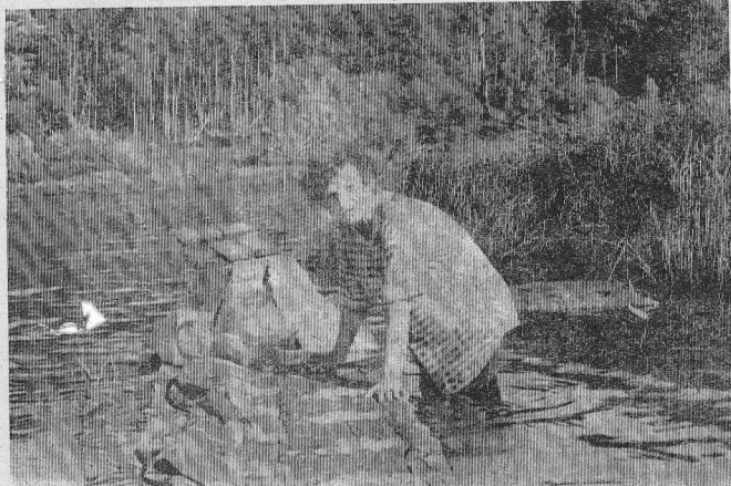
Речная вода. «БИО-С», шетка — и одеяла как новые.