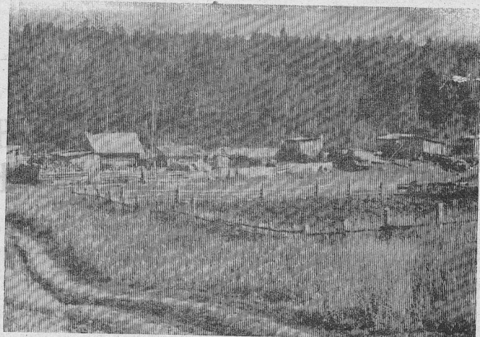
Поселок Ленинский (бывший Чапаевск) расположен на р. Чабодец примерно в 40 километрах выше с. Зыльдево. Бельгия новых времен его практически не затронула, даже названия не стали менять в соответствии с новой модой и живут там по старинке: практически натуральным хозяйством. Иногда приходит маши-

на с продуктами, но чаще ездят за ними сами. Старенькая дизельная станция выдает электричество по 3-4 часа в сутки, а остальное время — как в прошлые века. Правда, появляются времена, там энергичные люди с «стремительными» планами: то базу отдых построят, то мощный агрокомплекс создадут, но