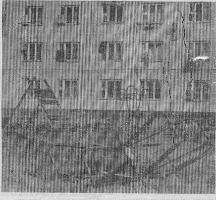
КОГДА ДЕТИ ЕЩЕ СПЯТ...

Учредители: трудовое коллектив редакции, администрация района, Управление печати и информации администрации Красноярского края.