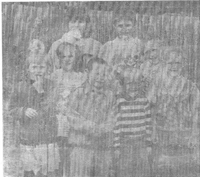
Мы — УСОЛЬЦЕВСКИЕ.