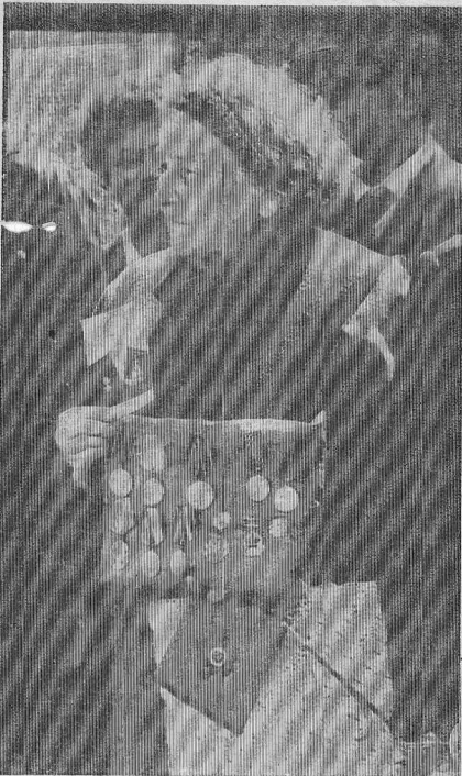
А МОЙ НЕ ДОЖИЛ..

КАК ЖДАЛИ мы этот день, как готовились к нему! Как надеялись, что природа не подкажет и подарит хорошую погоду. И она, будто поняв, что нельзя испортить праздник тысячам людей, нельзя перечеркнуть напряженный труд организаторов торжества, выдала нам замечательный денек — солнечный, теплый, радостный.