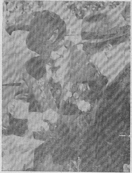
ЗА ПРАЗДНИК! ЗА ПЕБУДУ!

— Без преувеличения можно сказать, что весь город вышел на улицу, весь город пришел к памятнику, который все-таки успели всем миром отреставрировать к великой дате. Были традиционные выступления, оружейный салют в заложенные цреты и венки, был зажжен огонь и в основание памятника заложена гильза с посланием от ветеранов будущим поколениям. Но все же не это было главным, определяющим настроением праздника. Сияющие лица людей, цветы, улыбки, редкое для нынешних времен единение людей, идущих в колоннах, создавали незабываемую атмосферу ВСЕНАРОДНОГО торжества. Весь день 9 мая не смолкал в Кодинске праздничный