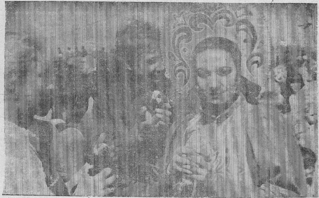
ГОЛУБИ МИРА В РУКАХ МОЛОДЫХ.

шум. Мероприятия сменяли друг друга, и везде в центре внимания были ветераны. Любовь, уважение, внимание к ним было искренним, неподдельным. Из всех сил старались работники отдела культуры, коллективы ресторана «Бередей» и кафе «Кодинская Зимка», чтобы встреча с ними была вкусно, уютно, весело, тепло, сердца вложили в свои выступления участники праздничных концертов.