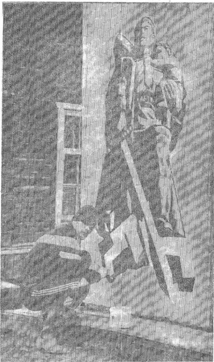
БОЛТУРИНО. СКОРО 9 МАЯ...