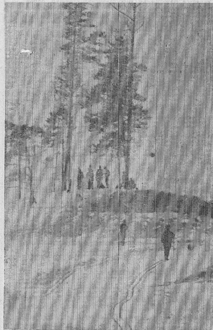
На лыжне в весенний день.