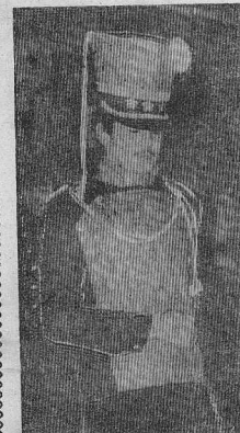
На снимке: один из моментов фестиваля солдатской песни. п. Татаря.