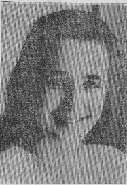
«Я с детства люблю смотреть на ночное небо, на луну... Небо не дает мне. Наоборот, какое-то светлое, хорошее чувство переполняет душу...»