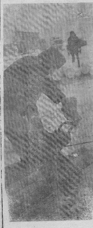
ЗИМА. И ХЛОПОТЫ ЗИМНИЕ.

ПРОДОЛЖАЕТСЯ ПОДПИСКА НА „СОВЕТСКОЕ ПРИАНГАРЬЕ“!