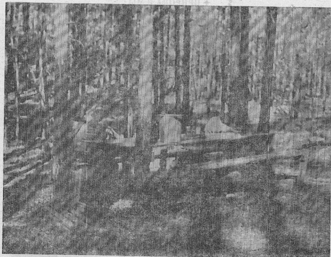
В ЛЕСНОЙ ТИШИ.