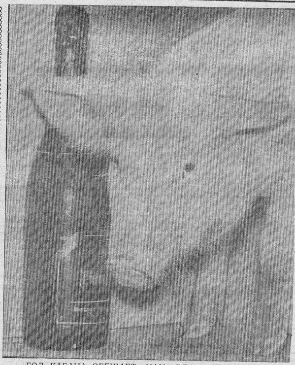
«ГОД КАБАНА ОБЕЩАЕТ НАМ БЛАГОДЕНСТВИЕ, ЗАРА- БОТКИ, РАСЦВЕТ ИСКУССТВА...» (из предсказаний астрологов).

Даю обидного мало, но все- таки были в уходящем году в нашем районе и новоселья.