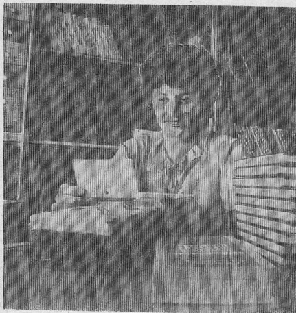
НАЛОГОВОЙ ПОЛИЦИИ — ОДИН ГОД

200 тыс. руб. 14. Новый деревообрабатывающий станок заводской (циркулярка) — 1 млн. руб. 15. Бочки 200-литровые. 70 тыс. руб. 16. Фляга 40 литров под бензин — 30 тыс. руб. Обращаться по телефону 2-24-18. (1349)