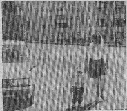
Приятно гулять по чистому городу.