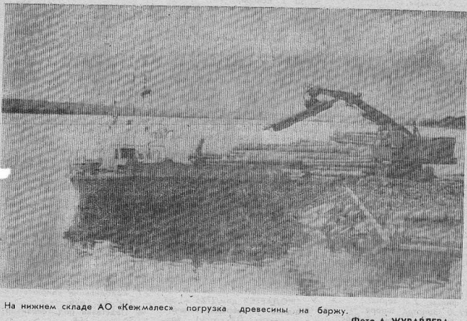
На нижнем складе АО «Кежмалея» погрузка древесины на баржу.