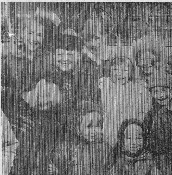
ДЕТИ с. СЫРОМОЛОТОВО ДАРЯТ ВАМ УЛЫБКИ.