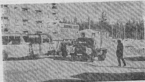
СТОИТ БЫТЬ ОСТОРОЖНЫМ.

Установлено также, что из числа всех, получивших травмы при ДТП, 60% погибает на месте происшествия и 8% — в соответствии с п. 2.5 Правил при ДТП водителям, причастные к нему, должны «принять возможные меры для оказания доврачебной помощи пострадавшим», а в экстренных случаях «принять возможные меры для оказания доврачебной помощи пострадавшим на путином, а если это невозможно, доставить на своем транспорте в ближайшее лечебное учреждение».