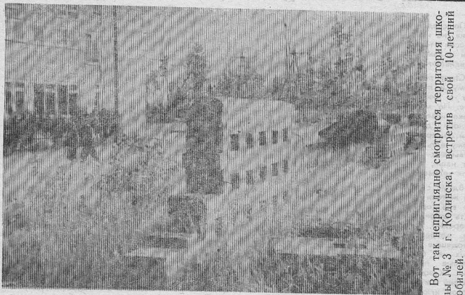
Бот так неспешно смотрится территория школы № 3 г. Козьмодемьянска, встретив свой 10-летний юбилей.