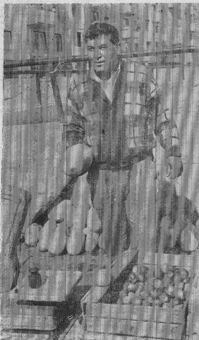
торговые ряды города.