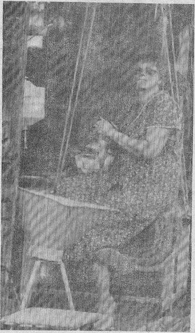
У кого-ного, а у хозяйки летом всегда много хлопот. И огород прополот, полить, прорыхлить; и дом побелить, покрасить; и заготовки на зиму сделать. Крутится женщина целый день, а коли даже и присядет, вновь работой руки заняты — надо прибрать рыбу.