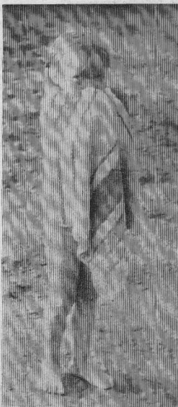
Я ТАК СМОГУ СОГРЕТЬСЯ, ЕСЛИ СИЛЬНО ПОДРОЖУ.

САМОЕ ДРЕВНЕЕ название этого месяца — СЕРПЕНЬ. Копнами, скирдами обломочной соломы помечает август свое нетеропливое шествие по земле. Пахнет солнцем, отборное зерно. Солнце греет по-прежнему, но ночью уже вьет прохладой. Короче стали дни. В темно-зеленой прическе деревьев у кустарников мелькают желтые пряди. Пламенеют грозды рябины, бузины, калины. Природа спешит отдать свои дары. Тыко в росе, на перелесках уюкли птицы. Не до песен — наступает время осенних перелетов. У горизонты все чаще увидишь черные стелы граничных стай; это тренировочные полеты. Лето переломилось, и первая при-