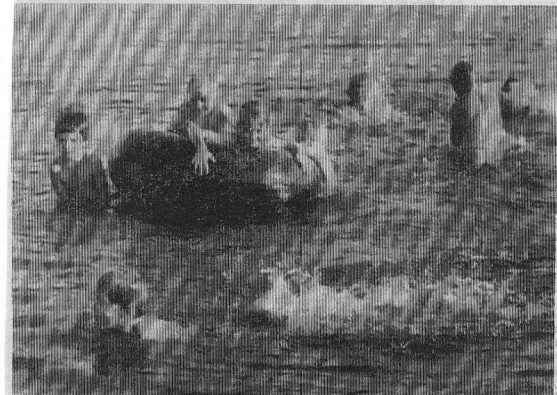
Солнце, воздух и вода — наши лучшие друзья.

Кежемская районная очно-заочная средняя общеобразовательная школа ПРОИЗВОДИТ набор учащихся в 8—12-е классы в следующих населенных пунктах: