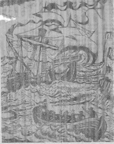
Резьба по дереву.