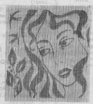
Резьба по дереву.

— Прежде всего хочу сказать, что все натуральное гораздо эффективнее, чем же крем. Овощи и фрукты — это изобилие витаминов, идеальный материал для косметических масок. Главное — не лениться, тем более что про-