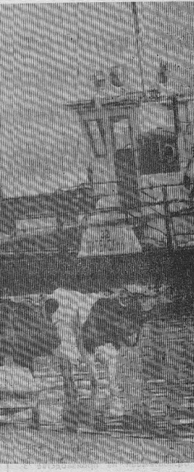
«Поехали, Буренка, покатавайся...»

ПРОДАЕТСЯ шпалорезка 6/у последней модификации по договоренности. Адрес: с. Заледеево, ул. Береговая, 31. (108)