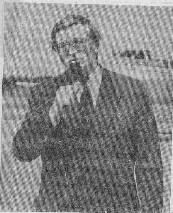
интервью программе «ВЕСТИ» перед отлетом; момент совещания; на территории ЗКПД.