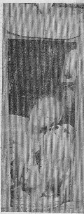
Мы с Джемом.