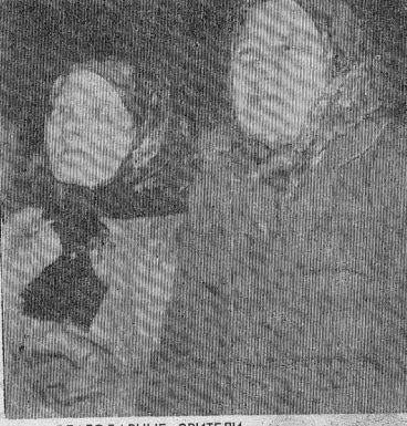
БЛАГОДАРНЫЕ ЗРИТЕЛИ.

В День Победы собрались яркинцы в свой сельский клуб, чтобы поздравить и пенсионеров тыла в фронтовиков, возлобы проведен вечер. И жить венки и прозо-