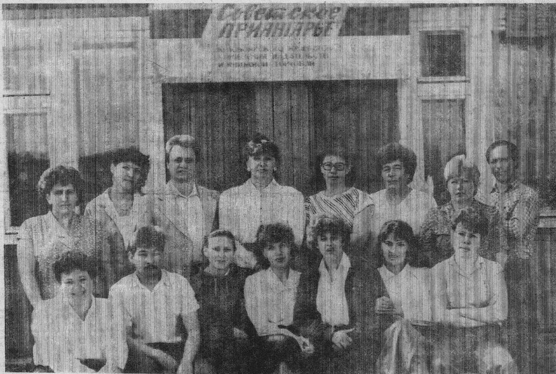
А ЭТО МЫ — «СП» (НО НЕ ВСЕ). НА ПАМЯТЬ ВАМ И НАМ.