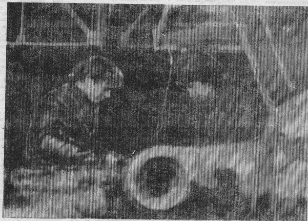
На снимке: в ремонтном цехе БелАЗов УАТ «Богучангэстрой» (бывшее АТП-12).

свечас все свои обещания поддерживают рабочие коллективы, особенно, когда зарплату не выдают в течение нескольких месяцев. Это большая проблема для многих семей. Думаю, что ее решение полагается стимулом к более продуктивному труду.