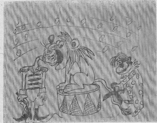
Рис. В. ЖАБКОГО